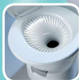
Risciacquo potenziato del 15%

Iscriviti alla nostra newsletter entro il 30.06.2013, potresti vincere il nuovo condizionatore a tetto Dometic FreshJet 1100. Clicca www.dometic.com/rvit