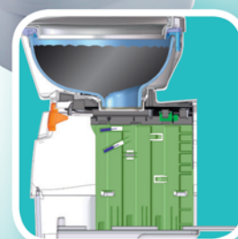
Forma ottimizzata dal punto di vista anatomico