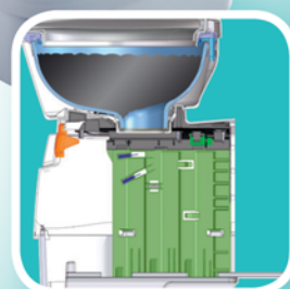
Forma ottimizzata dal punto di vista anatomico