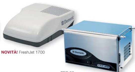
NOVITÀ! FreshJet 1700