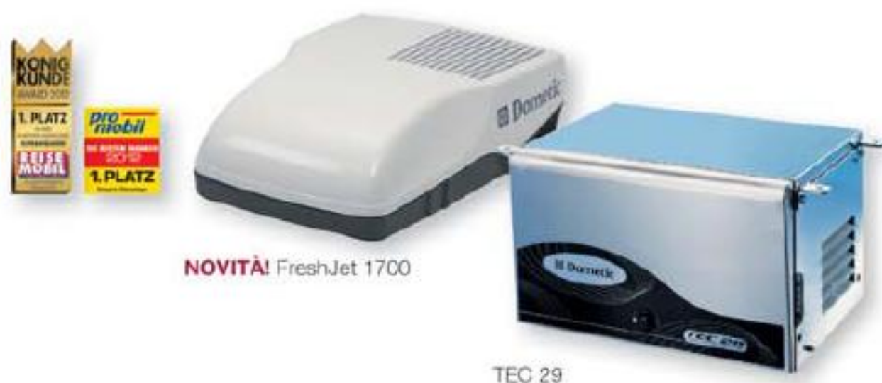
NOVITÀ! FreshJet 1700