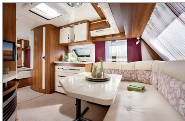
EXCELLENT 560 FFE

H obby, il maggior produttore di caravan al mondo, si presenta nella stagione 2014 con sei gamme di caravan per un totale di 60 modelli. Nella tipologia dei motorizzati propone la serie Premium Drive e Premium Van