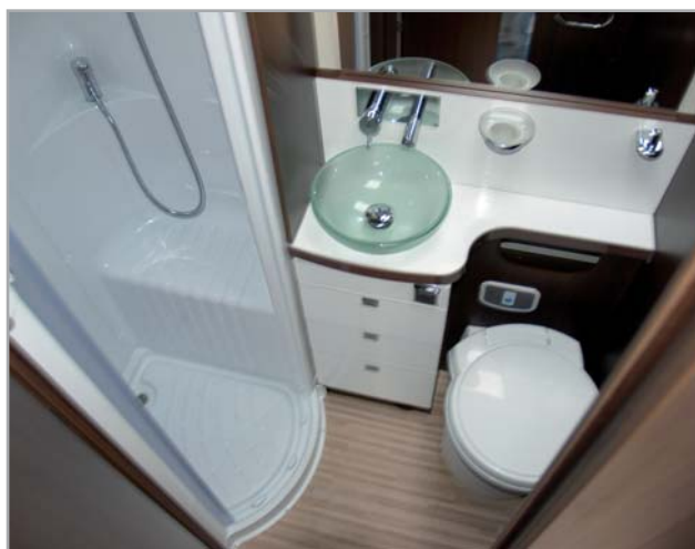
PERSEO 542 GARAGE