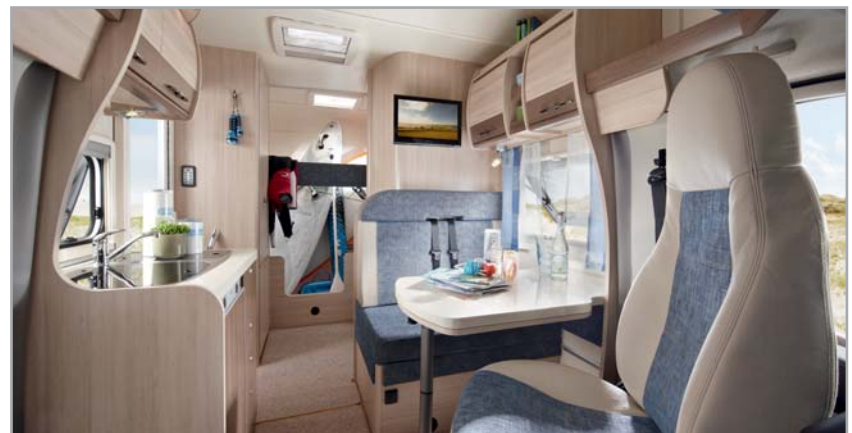
A55 GS SPORT