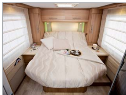
SINFONIA 65 XT