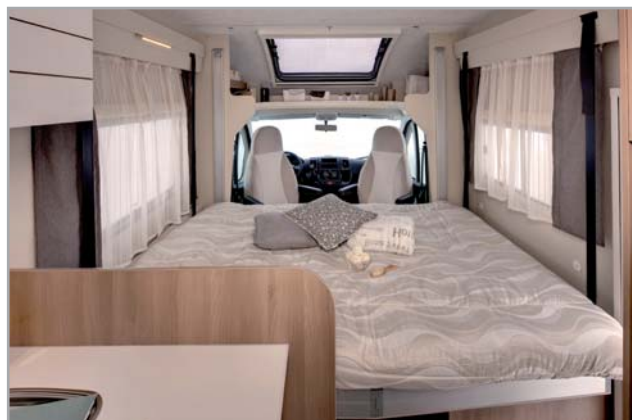
MAGIS 35 XT

C aravans International, marchio del Gruppo Trigano rivisita l'intera gamma operando una semplificazione su nomi e modelli. Gli Elliot lasciano il posto alla serie Magis che accorpa anche la precedente gamma X-Til S e presenta ben 14 layout (3 mansardati e 11 semintegrali). Tre le versioni con letto trasversale in coda e garage sottostante e sette i modelli profilati che prevedono il letto bascu-