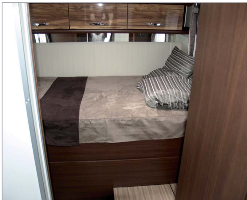
PERSEO 542 GARAGE