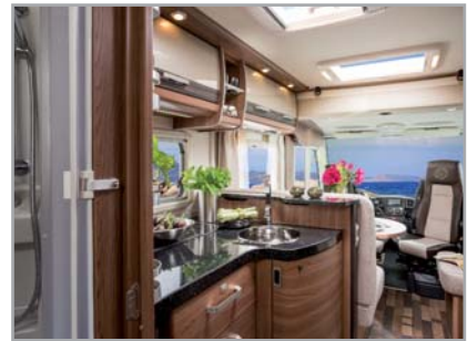
SKY I PLUS RM